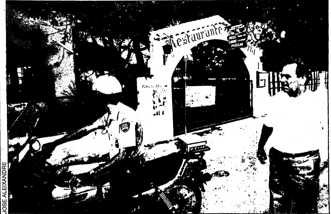
Las señales de los numerosos disparos quedaron reflejadas en el local. A la derecha, entrada al restaurante-pizzería del aeroclub.

Un comando de tres individuos le disparó mientras comía en Castellón