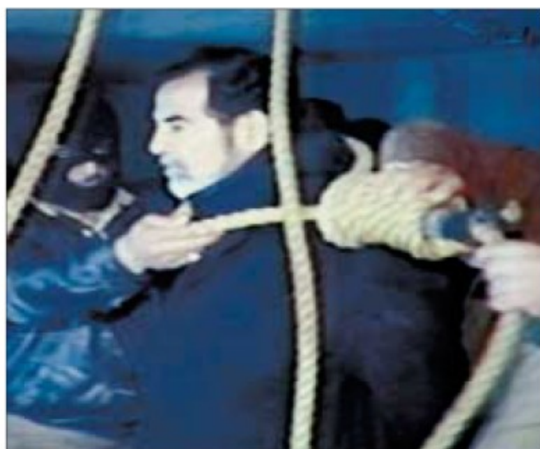
Sadam Husein, con la soga al cuello, antes de su ejecución.

EL MUNDO no se publicará mañana, 1 de enero, como es tradicional. Nuestra edición digital ofrece noticias actualizadas en www.elmundo.es