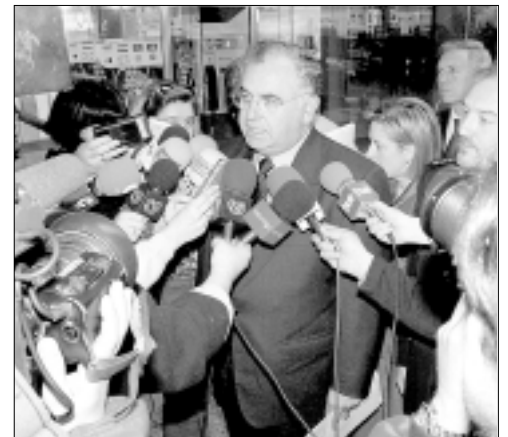
El director general de la Policía, Juan Cotino, ofrece las primeras informaciones sobre los hechos

Juan Cotino, que visitó a los heridos y a familiares de las víctimas mortales, anunció que el Cuerpo Nacional de Policía, en una reunión urgente, había acordado conceder al fallecido —en ese momento sólo se había producido una muerte—, la Cruz al Mérito Policial.