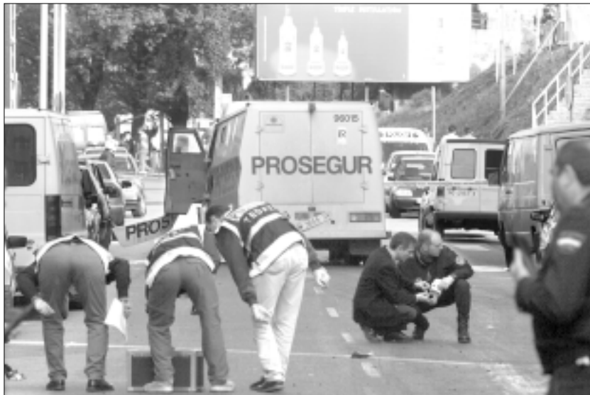
Agentes policiales examinan la zona en la que se produjo el tiroteo en busca de pruebas

grandes atracos o el GRAPO. A última hora de la tarde de ayer, en fuentes de la investigación no se descartaba ninguna de las dos posibilidades, aunque la segunda parece cobrar más fuerza. Brigadas especializadas desplazadas desde Madrid se han hecho cargo de la investigación.