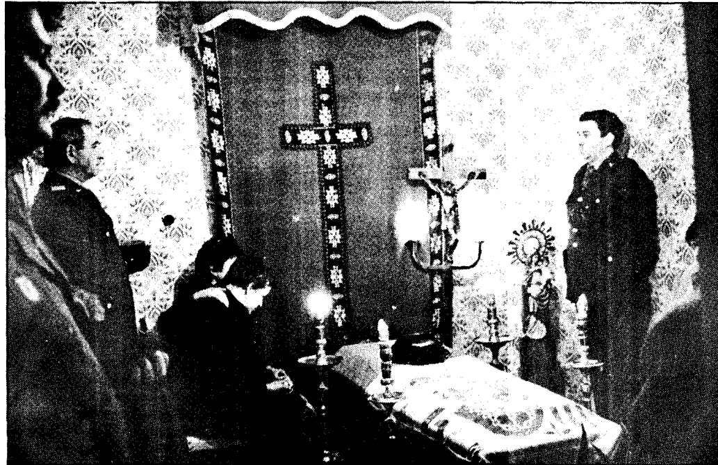
Los familiares del guardia civil asesinado recibieron el pésame de numerosas autoridades, que se desplazaron a la capilla ardiente instalada en el cuartel de Irixoa

El Banco Pastor, que en 1988 obtuvo un beneficio antes de impuestos superior en un 20,2% al del ejercicio anterior, descartó la venta de sus participaciones industriales. ★ Página 61