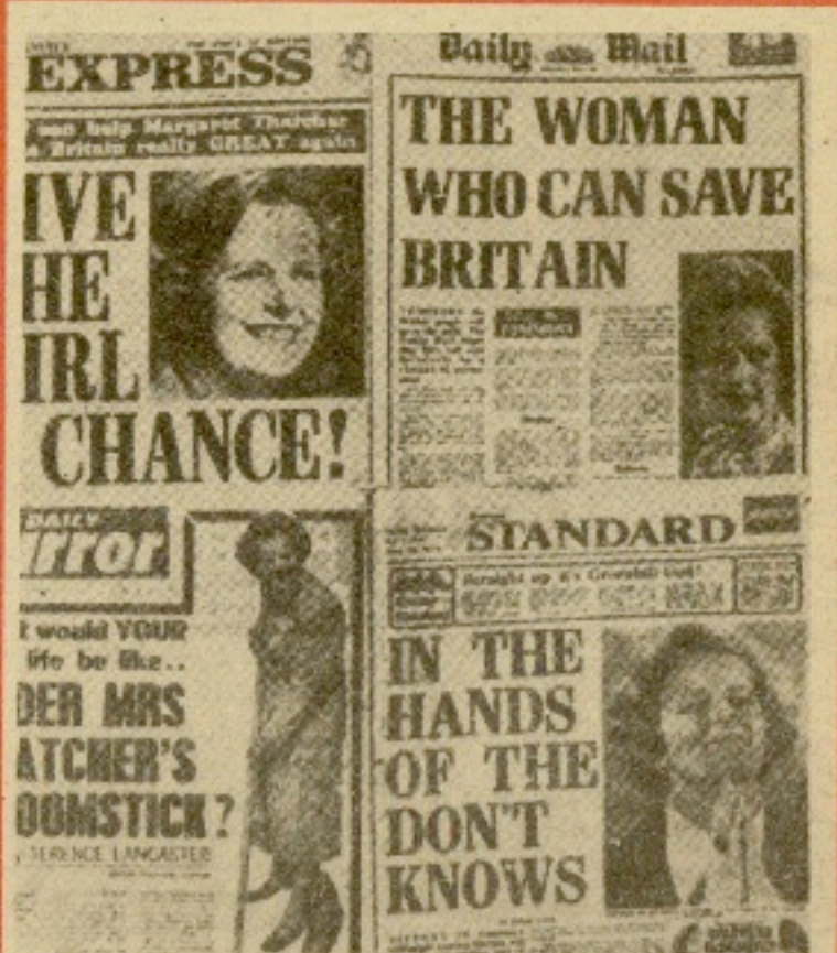
«La mujer que puede salvar a Gran Bretaña», «En manos de lo desconocido», «Déle a la chica una oportunidad...»; éstos son algunos de los titulares de la Prensa pro-conservadora británica a 24 horas de las elecciones generales de hoy.