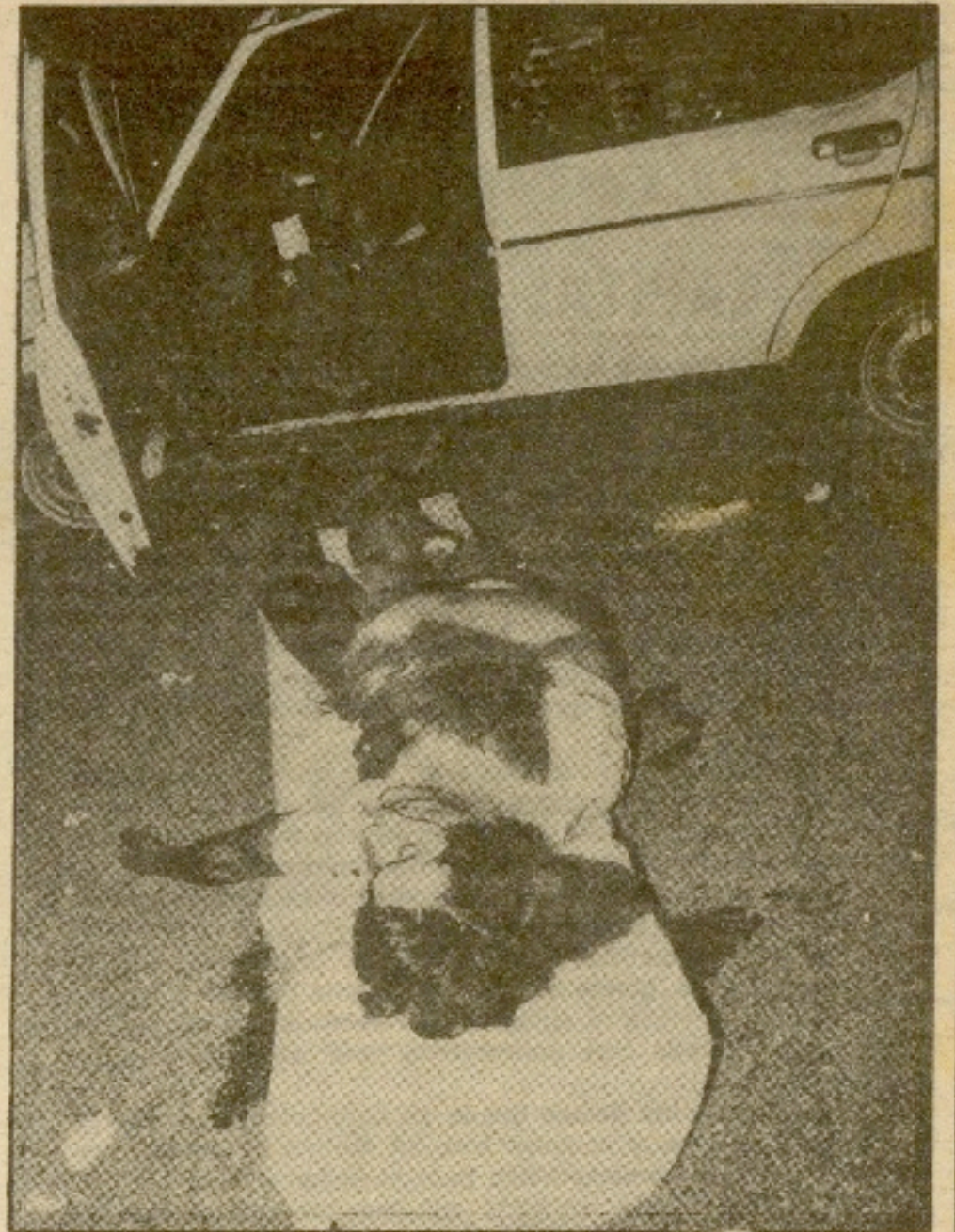
En el grabado de la izquierda, señalado con una flecha el lugar donde cayó muerto el policía nacional en la estación de Zumárraga y foto de carnet del mismo.