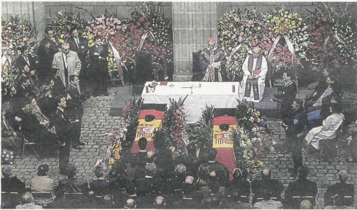
Aspecto de la ceremonia celebrada en el Gobierno Civil de Barcelona en memoria de los policías asesinados

Identificado uno de los miembros del comando itinerante detectado en octubre en Zaragoza • pág. 13