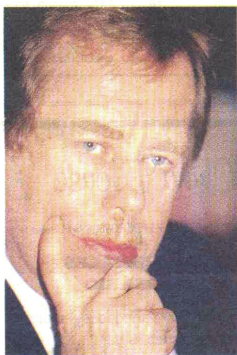
Vaclav Havel, un intelectual seductor

cambio de tendencia de la marcha de las empresas con respecto a los últimos cinco años y el empeoramiento de la coyuntura en 1990, apuntado hace unos días por Mariano Rubio, como consecuencia de la política de ajuste del Gobierno. El declive de los beneficios está provocado por el aumento de costes y la caída de márgenes. PÁGINA 61