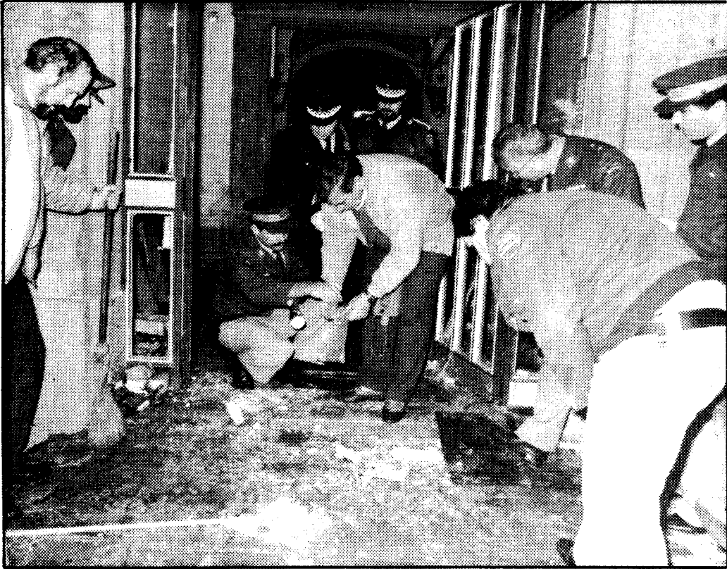
Expertos en explosivos de la policía recogen restos de metralla a la puerta del inmueble

En el momento de las explosiones, pasadas las seis de la tarde, se encontraban en el local unas veinte personas. Todos ellos eran soldados de la US Navy, a excepción de la encargada de atender el mostrador, de nacionalidad española. Los "marines" heridos procedían del destructor "Thorn" y de la fragata "Beary", anclados en el puerto de Barcelo-