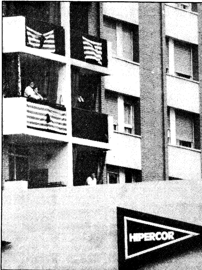
Banderas catalanas con crespones negros, en los bloques colindantes

AP pidió al Gobierno la "adopción de medidas firmes que pongan fin a esta tragedia social" y so-