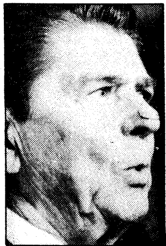
En la punta de la nariz, un pequeño apósito cubre la zona de la que eliminaron células cancerosas