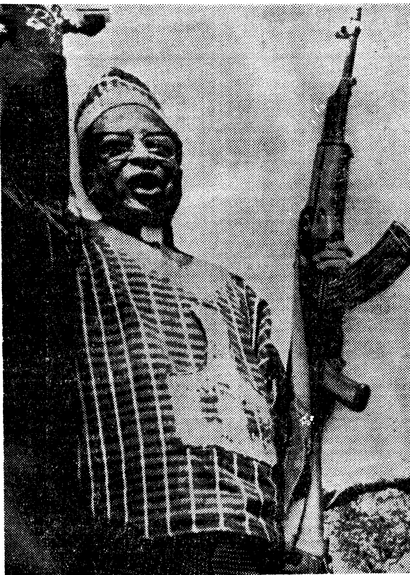
Esta instantánea del obispo Muzorewa fue tomada en agosto de 1978 en una concentración celebrada con motivo de un alto el fuego en la guerra de guerrillas. Muzorewa blande un rifle fabricado en un país comunista.