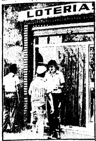
La administración número 1