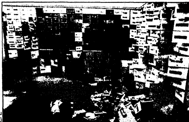
Los ladrones desvalijaron 300 cajas de seguridad.