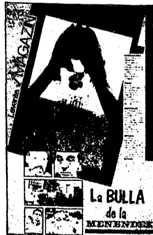
La BULLA de la MENÉNDEZ

Un nuevo comando de ETA reivindica el atentado de Castellón