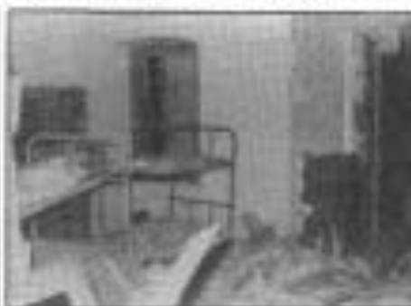
La última sala del cuartel, antes de comenzar de la entrada de la granada lanzada desde el cuartel.