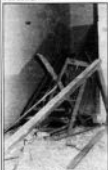
El niño murió cuando se le disparó en su patio. Muere de 17 años, cuando se le disparó contra el cuartel de la Guardia Civil.

Unos 200 de la Guardia Civil, armados con armas de guerra, dispararon contra un vecino de Leiza, un niño de 17 años, que se encontraba en el patio de su casa, cuando se le disparó contra el cuartel de la Guardia Civil.