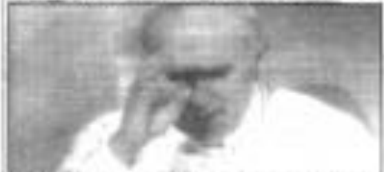
El Papa Juan Pablo II en un momento de su visita a España.

«Con ella os digo: ¡Tened ánimo, vivid la esperanza, sed fieles a vuestra fe!»