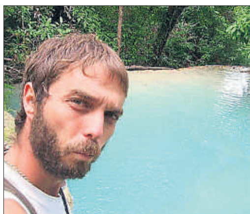
Viajero. Vivió en Francia y Argentina

a los afectados por el terremoto del 2010