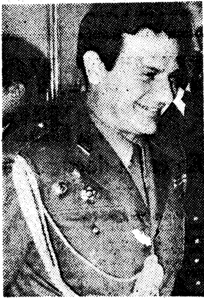
(Viene de la página anterior.)

La policía no ha facilitado, comunicado sobre el asunto, aunque parece que dirige su investigación cerca de los medios izquierdistas y revolucionarios franceses o españoles refugiados.